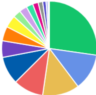
DFDs POR ÁREA DEMANDANTE