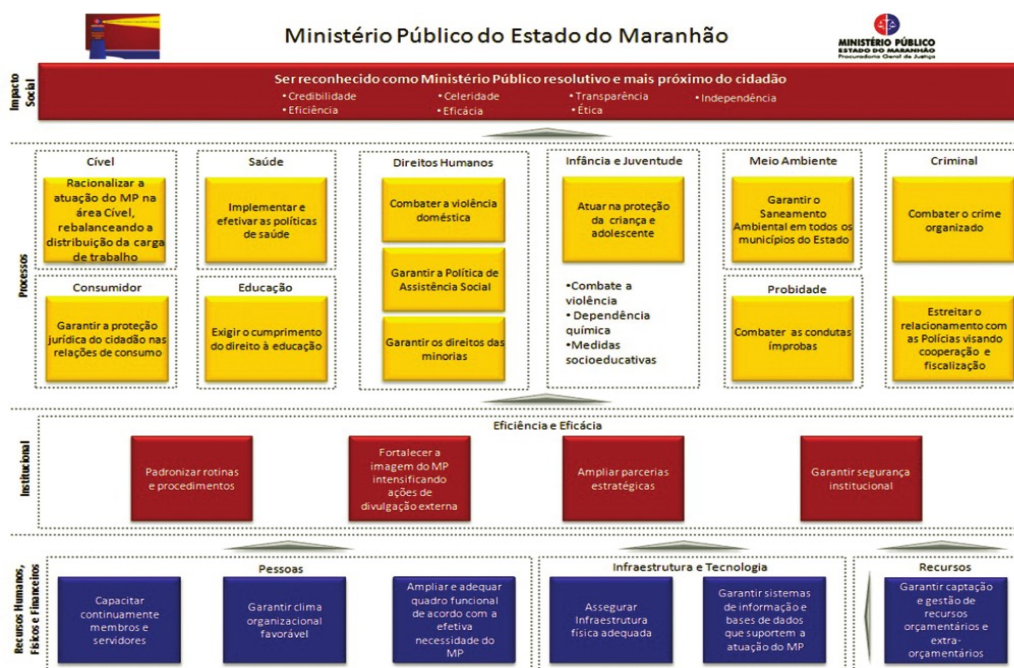
Figura 1 - Mapa Estratégico do Ministério Público (2012-2016)